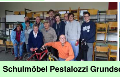
Schulmöbel Pestalozzi Grundschule 7.4.2017