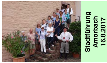
Stadtführung Amorbach 16.8.2017