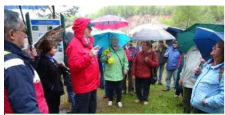
55plus Sailauf „Steinbruch“ 3.5.2017