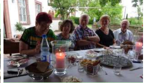
Wein&Reim Stiftsberg KF Zentral 20.7.2017