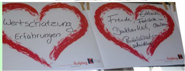
Diozesanversammlung in Schweinfurt 25.3.2017