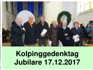
Kolpinggedenktag Jubilare 17.12.2017