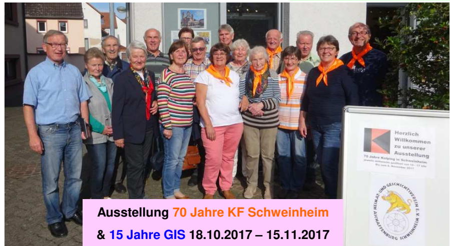
Ausstellung 70 Jahre KF Schweinheim & 15 Jahre GIS 18.10.2017 – 15.11.2017