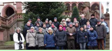
Besuch KF Woffenbach 7.1.17 Stadtführung, „Kripperlweg“, Mittagessen mit Oberbürgermeister Klaus Herzog