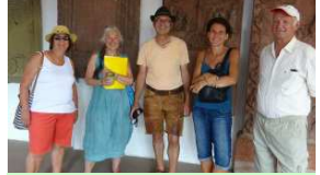
Führung Sonnenuhr 21.6.2017