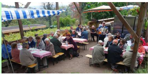
55plus „Kippenburg & Weinberg“ Godelsberg“ 20.9.2017